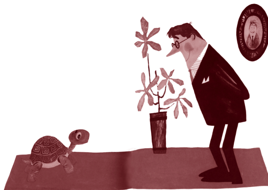
Žyrafa , ill. Miroslav Pokora, Dwie Siostry

Un dossier riche et largement illustré qui permettra de parcourir l'Europe à travers le temps et l'espace, du nord au sud, à la rencontre de ceux qui font cette littérature : auteurs, illustrateurs, éditeurs, de ceux qui l'analyse et qui permettent d'affiner notre regard, ainsi que de ceux qui travaillent à ce qu'elle parvienne aux jeunes lecteurs.