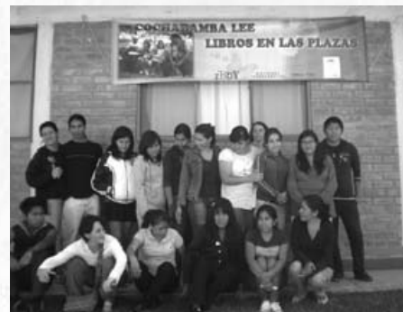
Profesores de la “Casa de los niños” posan después del taller

Habiendo recibido una capacitación muy amena y accesible - aproximadamente 12 personas - en la comunidad educativa “Arco Iris de Paz”, de la Fundación “Casa de los Niños” entre jóvenes y maestras, se dio inicio a la experiencia de lectura fuera de un contexto educativo.