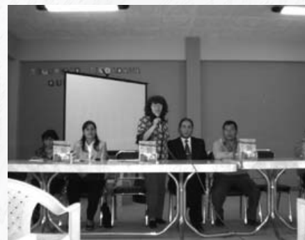
Ceremonia de presentación del libro

¡Novedad Sacabeña! Ya que fue publicado el 2º libro sobre la memoria oral de Quintanilla, que recupera las historias contadas del lugar y sus pobladores. El primero fue en Sacaba hoy le toco a Quintanilla.