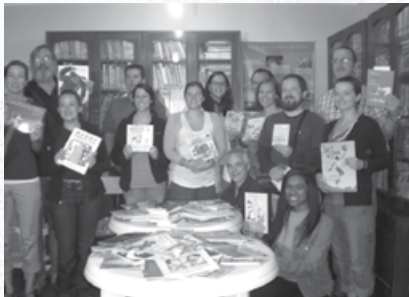
Docentes de la Universidad de Apalaches