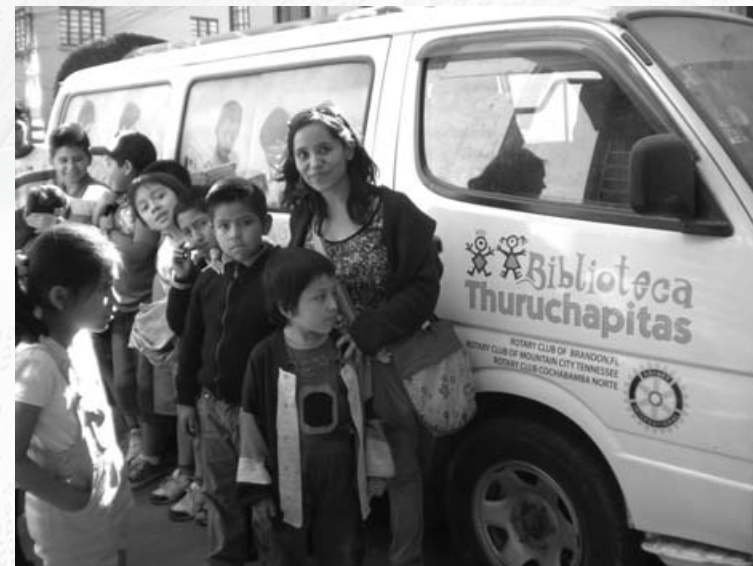
Niños y animadora en programa “Ciudad y Literatura”

Nuevamente el bibliobús de la biblioteca Thuruchapitas volvió a provocar emociones con la lectura de cuentos a los estudiantes de 4º, 5º, 6º cursos de la escuela “Buenas Nuevas” durante tres semanas.