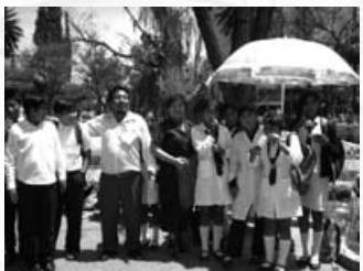
Profesores y alumnos de Quillacollo en la Plaza Colón

Fue una experiencia muy interesante para mis estudiantes del nivel secundario de la Unidad Educativa “Oscar Alfaro” que se encuentran en Pandoja, Quillacollo. Preparamos algunos cartels con textos cortos como “Ven a leer conmigo”, “Ven a leer amigo”, “El libro es nuestro amigo, entre otros.