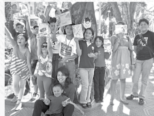
Niños lectores compartiendo cuentos