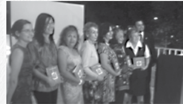
Coordinadoras de diversos países en Puerto Rico

Hace dos décadas exactamente, el PIALI, con su programa internacional “Te regalo un sueño” viene convocando, cada dos años, a través de las coordinaciones nacionales a niños y niñas entre 6 y 12 años de edad para que escriban cuentos. En nuestro caso, el Taller de Experiencias Pedagógicas es el encargado de promover talleres de escritura creativa para niños y profesores para que éstos puedan a su vez realizar talleres sostenidos en sus escuelas de tal modo que los cuentos escritos por los niños sea resultado de los mismos, sin la injerencia de miembros externos al taller: papás u otros.