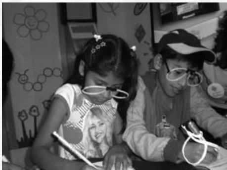
Talleres con niños a cargo de la Fundación “Viva, estás vivo”