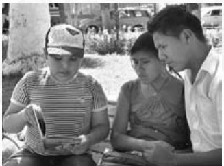
Los niños de la Biblioteca Thuruchapitas también van a la Plaza Colón a conquistar lectores.

Continuando con el programa de promoción de lectura de la biblioteca “Turuchapitas en las plazas”, asistí a la plazuela del Prado. Muchas personas veían los libros sobre el pasto - tan hermosos y variados - que se acercaban para preguntar si estaban a la venta, Yo les explicaba el programa y los invitaba a leer los libros. Los niños de una familia me hicieron leer muchos cuentos, estaban encantados y no querían moverse del lugar. Otras personas me felicitaban por promocionar la lectura, Estaban todos impresionados.